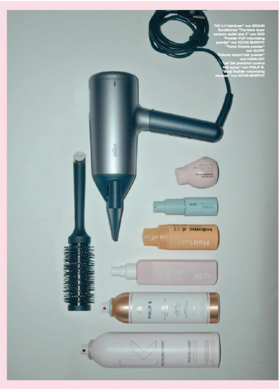
Elias Kolaczek modelbook

grösse . height 1.89 . 6'2.5 konfektion . size 48 (38) . 50 (40) oberweite . bust 99 . 38 taille . waist 75 . 29 hüfte . hips 94 . 37 schuhe . shoes 45 augen . eyes braun . brown haare . hair blond / dunkel . light / dark